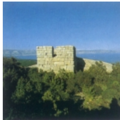
Utvrda Tor iznad Jelse

Ipak najzanimljivija građevina ne nalazi se u Jelsi, već na brežuljku koji jugoistočno dominira jelšanskim poljem i okolnim zaljevom. To je Tor, prapovijesna gradina s nasambama, građena vjerojatno u 3. stoljeću prije Krista. Najbolje sačuvani dio čini utvrda četvrtastog tlocrta, visoka do 8 m, građena fino kle-