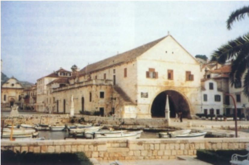
Arsenal i kazalište u Hvaru

rizam je, nastavlja svoje izlaganje prof. Lakoš, gotovo jedina gospodarska grana. Doduše ima ponešto i vinarstva. Zanimljivo je da se ipak u teškim ratnim godinama pojavilo značajno zanimanje za ribolov. U nekadašnjoj trajektnoj luci Vira sada ima 13 koča, a u ratu ih je bilo čak 26. Mnogi su, u nedostatku turista, uštedevinu uložili u ribolov koji je, osim za osobne potrebe, bio gotovo zanemaren. Pojačan je i uzgoj lavande, uređeni su zapušteni maslinici, a proizvodnja maslinova ulja pokazala se zanimljivim "biznisom", tako da se već pojavljuju privatne punionice. Uredili su se i povrtnjaci s manjim plastenicima, a sadi se čak i cvijeće. Obnavljaju se i mnogi zapušteni vinogradi. Slobodno se može reći da je rat vratio Hvarane moru i polju, a uloženi trud daje rezultate jer se sve uspijeva prodati.