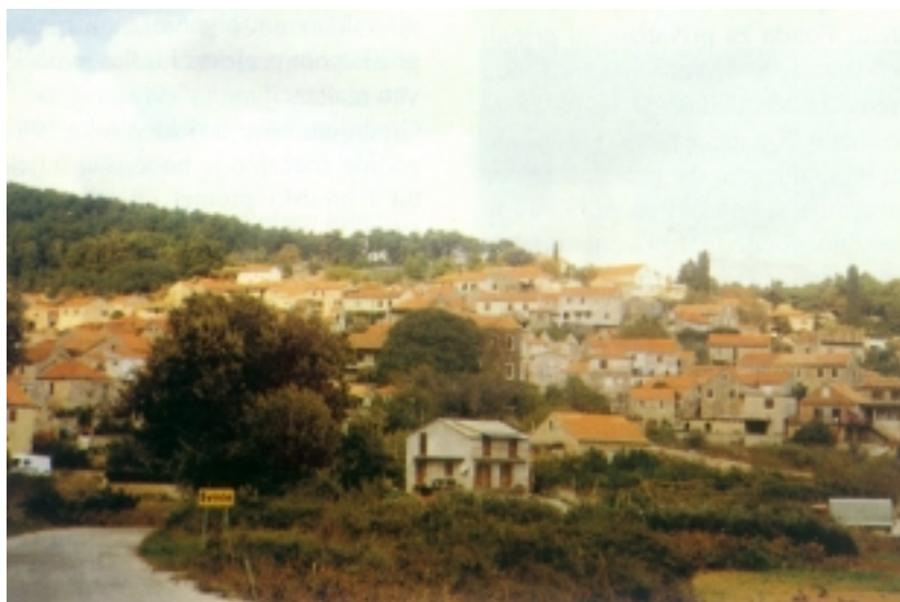
Pogled na Svirče

Nešto južnije, a jugozapadnije u odnosu prema općinskom središtu, smješten je Vrisnik (240 stanovnika) koji je nastao kao izdanak obližnjih i nešto južnijih Pitava. Naselje je nastalo prije 14. stoljeća, jer se spominje u hvarskom Statutu, a ime mu potječe od vrijesa. Graditeljski je neobično zanimljiva grupa kuća Bojanić na obronku prema Svirčima, a Bojanići su početkom 19. stoljeća imali najveći brod (brik) na otoku.