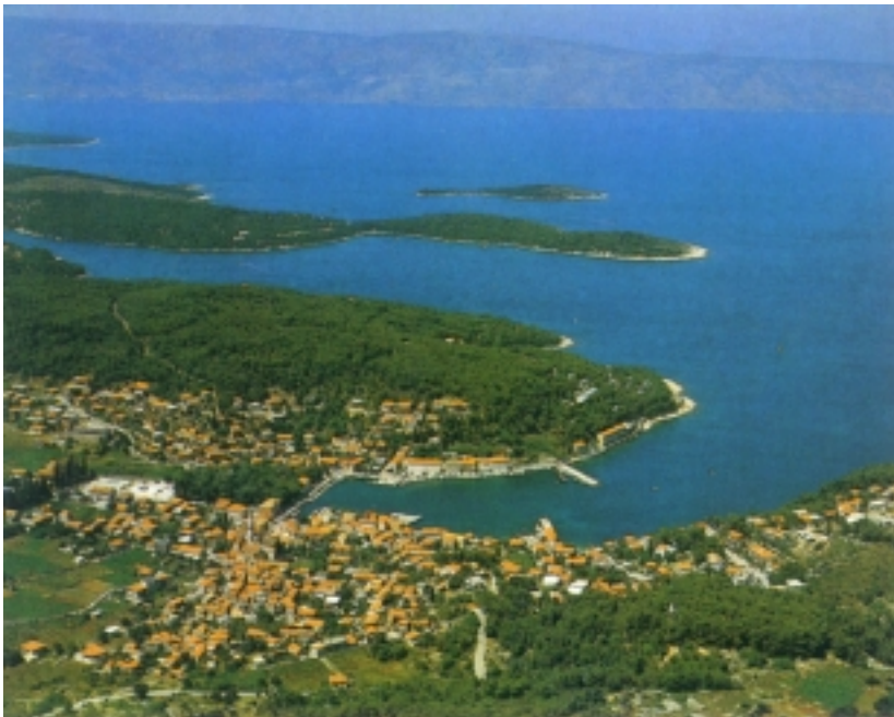
Pogled na Jelsu i dio Hvarskog kanala

cu, brodarsko oko Sv. Ivana i pitavsko na tigu oko crkve. Crkvi Sv. Marije pridodane su najprije utvrde, potom je preimenovana u župnu crkvu Sv. Fabijana i Sebastijana, a za turskog napada 1571. godine spasila je Jelšane od turske opasnosti.