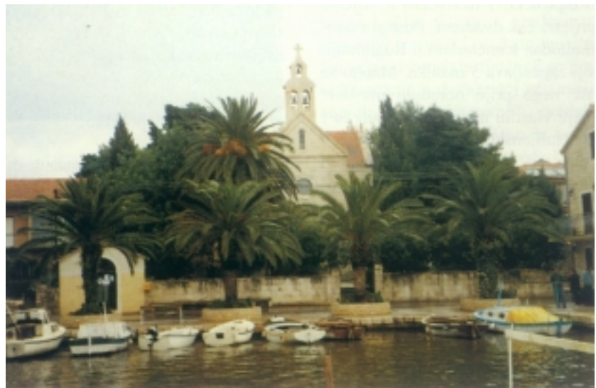
Crkva Sv. Ante i obala u Sućurju

Inače i Jelsa s desetak klubova pripada športskim općinama. Upravo je na izlasku iz mjesta, u blizini otočke prometnice, započela izgradnja športske dvorane, koju gradi poduzeće MGA iz Metkovića. U ljetnim se mjesecima (od 20. srpnja do 20. kolovoza) održavaju Dani Antuna Dobronića , u spomen na slavnoga hrvatskog skladatelja, glazbenog pisca i pedagoga, koji je rođen u Jelsi 1878., a umro 1955. godine u Zagrebu.