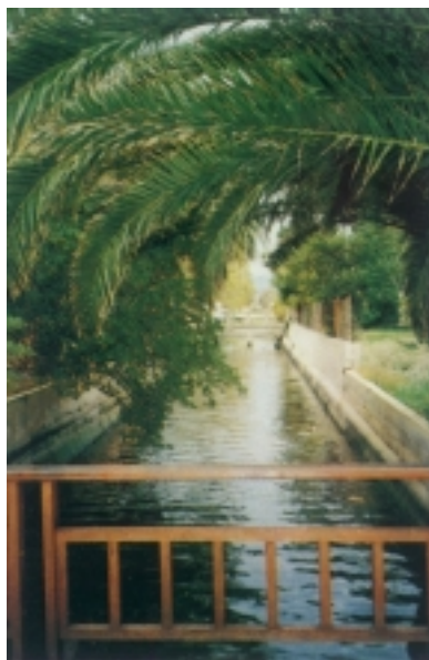
Detalj iz parka u Jelsi

utvrda koja je u više navrata preuređivana, a posljednji put 1887. kada joj je fasada dopunjena bijelim mramorom. U unutrašnjosti se čuva slika Bogorodice sa sv. Fabijanom i Sebastijanom , rad venecijansko-flamanskog slikara Pietra de Costera. U crkvenom su dvorištu skupljeni brojni kameni izlošci sakupljeni na raznim mjestima. Najslikovitiji je