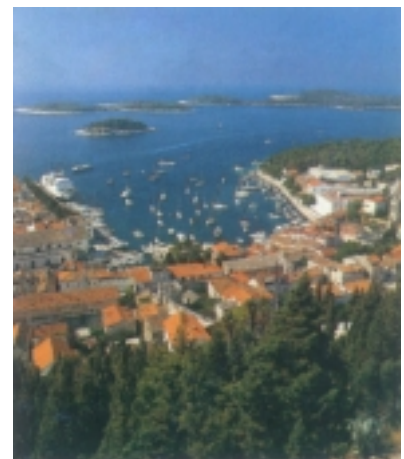
Pogled na hvarsku luku

približno 12 km zračne linije, od općinskog je središta udaljena više od 40 km. No u Građevinaru se dijelom već o tome pisalo (broj 3/99). Uskoro će se potpunim završetkom tunela Selca-Dubovica prometna izoliranost Sv. Nedjelje smanjiti, a potpuno će nestati namjeravanom gradnjom ceste od Dubovice do Svete Nedjelje. Inače naselje leži ispod najvišeg vrha otoka Sv. Nikole i ispod špilje koja je bila naseljena još u neolitikumu, da bi u srednjem vijeku poslužila za smještaj augustinškog samostana koji je djelovao