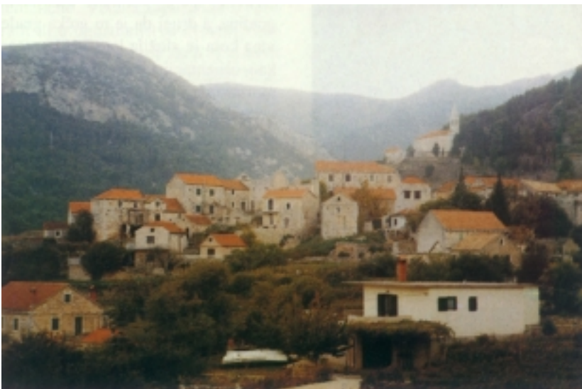
Pitve - najstarije hvarsko naselje

Općinsko središte Jelsa (1792 stanovnika) nastalo je u 14. stoljeću kao luka Pitava, iako tragova života ima iz prapovijesti i iz antičkih vremena, čemu su pridonijele mnoge pogodnosti. Ime dolazi od jelhe, vrste bjelogoričnog drva. Nastalo je oko crkve Sv. Marije i uz bogate izvore vode. Na mjestu južnog ruba današnje Pjace već se početkom 15. stoljeća razvilo malo ribarsko naselje koje će se u 16. stoljeću razviti u posebno naselje s više od 1000 stanovnika. Slobodno bi se moglo reći da se Jelsa sastoji od četiri međusobno odvojena naselja koja su se nesmetano razvijala u prostranoj uvali. To su spomenuto ribarsko naselje oko Sv. Mihovila, seljačko u Banskom dol-