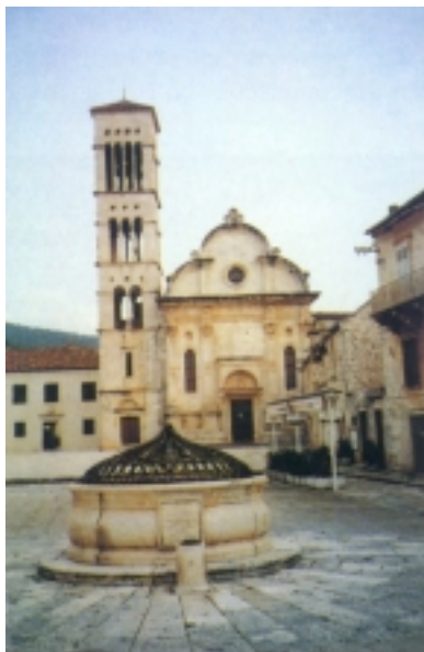
Gradski trg i katedrala Sv. Stjepana u Hvaru

O gradu Hvaru već smo dosta govorili. Povijesna je jezgra grada nastala oko trga smještenog između dva brežuljka. Gradski je trg najveći od svih trgova u starim dalmatinskim gradovima (4500 m 2 ). Usred trga stoji veliki gradski bunar. Istočnu stranu trga zatvara renesansna trobrodna katedrala Sv. Stjepana sa zvonikom i biskupskom palačom, građena u 16. i 17. stoljeću. Oltari ove crkve prepuni su vrijednih slika slavni autora (Domenico Uberti, Juan Boschetuso, Palma mlađi i dr.), a crkva ima i bogatu riznicu, odraz nekadašnje raskoši i bogatstva.