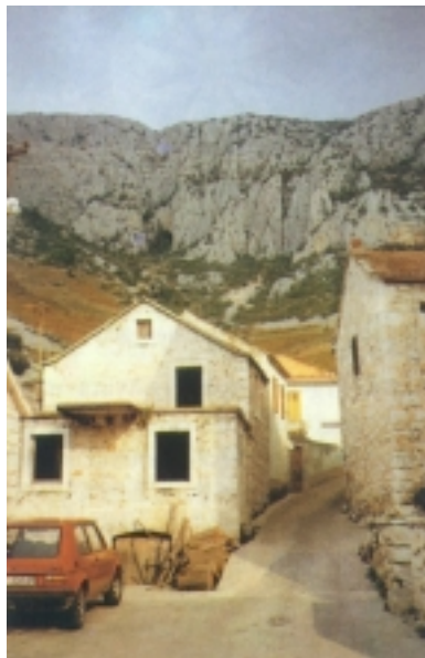
Detalj iz Svete Nedjelje

Hvar is the island of many settlements. The biggest one is the town of Hvar which is an important tourist center of the island and Dalmatia. The town of Hvar comprises several smaller nearby settlements well known for the cultivation of lavender, as well as the settlement of Sveta Nedjelja, a locality situated on sunny southern hills of the island and known for wine production. The town of Stari Grad lies at the edge of a deep bay on the one side, while bordering a fertile valley on the other. Stari Grad has been successful in using its rich architectural heritage to attract vacationers although in recent times a high significance is also given to agricultural activities in the fertile valley surrounded with a number of smaller settlements. The municipality of Jelsa includes a picturesque town of Vrboska where a multitude of valuable old paintings can be seen, as well as many other nearby settlements. Jelsa is a large tourist center with highly developed agriculture. The least developed area is the eastern portion of the island where Sućurje is the municipal center and ferry port. This town is inadequately linked, by a narrow road, with other parts of the island.