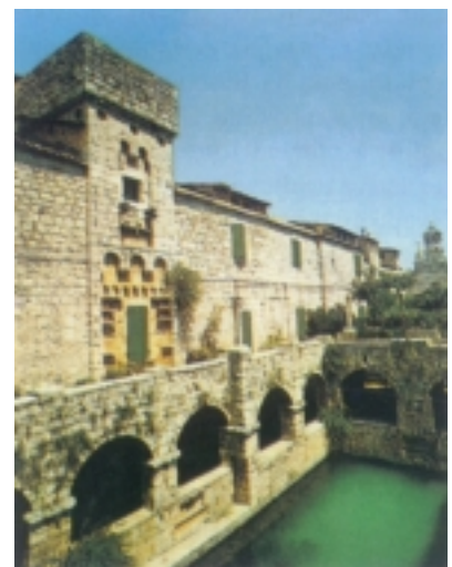
Ribnjaku u sastavu Tvrđalja

O Starome Gradu i njegovom naselju već smo opširno govorili. Stari Grad, koji danas ima 1836 stanovnika, leži na rubu duboke uvale i velikoga i plodnog polja. Grad se počeo razvijati uz južni rub zaljeva, a to je i današnja njegova jezgra. Kontinuitet naselja dokazuju ostaci iz rimskog i starokršćanskog doba (mozaike, starokršćanska krstionica, crkva Sv. Ivana). Pod sadašnjim se imenom prvi put pojavljuje 1205. u obliku Civutus Vetus. Najznačajniju građevinu, utvrđeni ljetnikovac zvan Tvrđalj, izgradio je oko 1520. godine književnik i patricij Petar Hektorović.