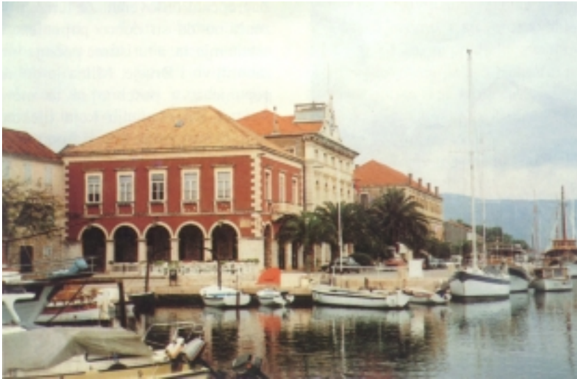
Obala u Starom Gradu

vatrogasno društvo koje ima dovoljno vozila i opreme, a zahvaljujući volenterskim dežurstvima u posljednje dvije godine nisu na području između Hvara i Starog Grada imali ni jednog požara. Doduše prije toga su bila dva katastrofalna koja su značajno promijenila sliku ovog dijela otoka.