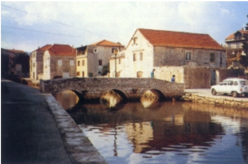
Kameni most u Vrboskoj

ali sigurno je da je taj slavni hvarski pučanin živio u Vrboskoj te da je upravo u njoj buna i započela.